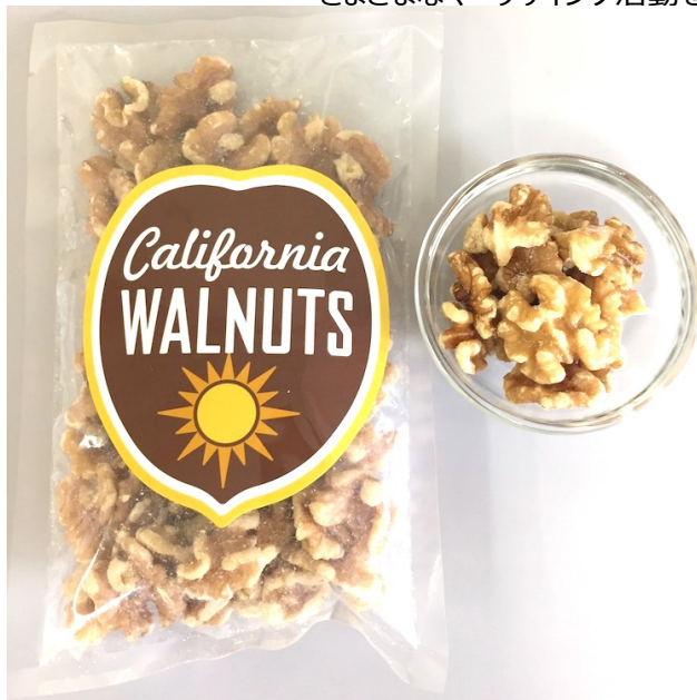
カリフォルニア産くるみ

海外では日本のほか、カリフォルニア産くるみの主要マーケットであるイギリス、ドイツ、スペイン、EU、韓国、インド、トルコ、中東、カナダに代表事務所を置き、良質なカリフォルニア産くるみを広めるためのさまざまなマーケティング活動を展開しています。