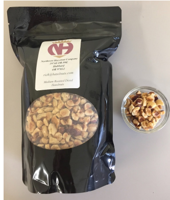
ダイスト・ ヘーゼルナッツカーネル

ノースウェスト・ヘーゼルナッツ・カンパニーは、今から約40年前、洗浄と乾燥ラインのみの伝統的な方法でヘーゼルナッツの加工を始めました。現在までに姉妹企業であるジョージ・パッキング・カンパニーと共に全米で最大のヘーゼルナッツ加工販売会社に成長しました。現在では最先端の加工技術を導入し、14品種のヘーゼルナッツを栽培、顧客ニーズに合わせた規格商品を開発し、世界中の市場へ出荷しています。