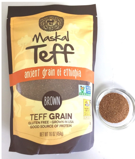
ブラウン・テフ (グレイン)

ザ・テフ・カンパニーは、アフリカ・エチオピア原産の小さな粒をした穀物、テフの栽培をアメリカで初めて成功させた会社です。エチオピアではテフを水でとき発酵させて生地を焼いたインジェラと呼ばれるフラットブレッドが主食。当社は創業以来過去35年以上にわたって「マスクアル・テフ」ブランド製品を米国内のエチオピア人、エリトリア人コミュニティに供給してきました。現在では、それ以外の人たちにも高タンパクで鉄分を多く含み、栄養価に優れた美味しいテフが支持されるようになり、消費量も伸びています。日本の皆様にも、テフの素晴らしさをあらためて知っていただきたいと願っています。