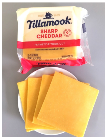
熟成チェダーチーズ スライスタイプ

ティラムックが一貫して提供する高い品質、美味しさ、付加価値は、目先の利益追求よりも品質確保と顧客の信頼に応えることを常に最優先とすることで、生み出すことができたのです。