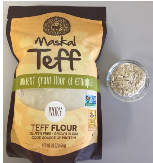
アイボリー・テフ粉