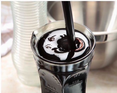
ドライミッションフィグ (黒イチジク) 濃縮ジュース

バレー・フィッグ・グロウーズは、北米最大のイチジク農協組織です。設立以来、アメリカのイチジク生産のメッカ、カリフォルニアの肥沃なサンホアキン・バレー（渓谷）を拠点とする30以上のイチジク生産者により構成され、カリフォルニア産イチジクの約40%を生産しています。業務用、一般家庭用共にイチジクの用途は多岐にわたり、様々な食のシーンでその優れた栄養価と美味しさが喜ばれています。私共が生産供給する栄養溢れるイチジクは、全てNon-GMOでビーガン・グルテンフリー食品としても人気を博しています。イチジクの高い滋養分、唯一無二の美味しさ、健康にもたらす様々な効能について知るほどに人々はこの不思議な果物の魅力にとりつかれてしまうのです。