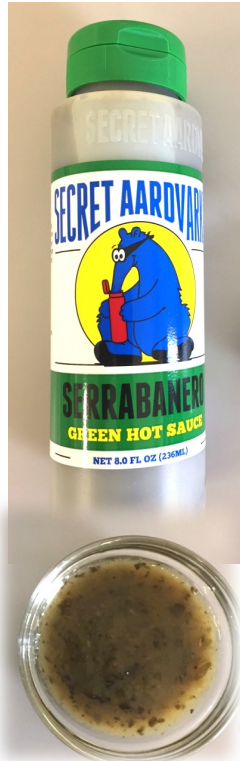
セラバネロ・ホットソース