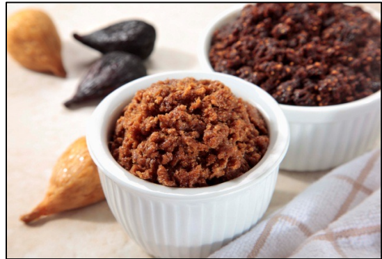
ドライミッションフィグ (黒イチジク) パースト