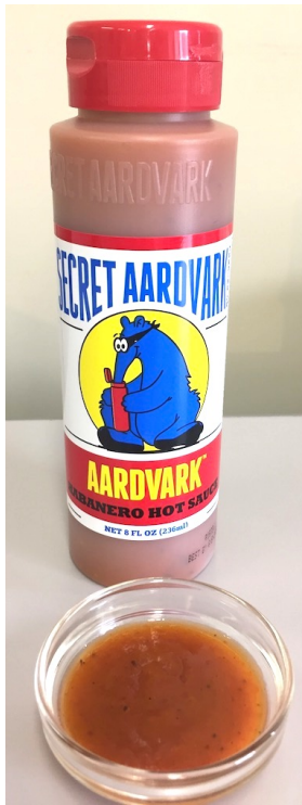
ハバネロ・ホットソース