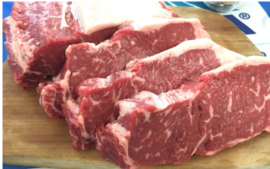
ストリップロイン

当社が誇る最高級ブランドであるスネークリバーファーム(米国産交雑種)、アメリカンビーフでお馴染みのダブルアールランチとセントヘレンズビーフは、特にホテル、レストラン業界から高く評価されています。