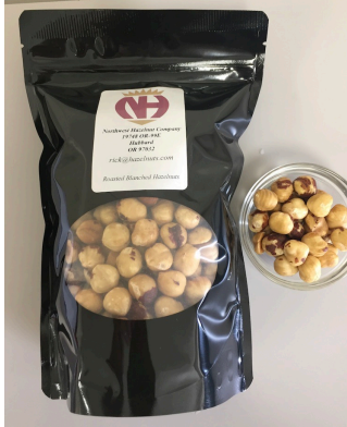
ブランチ・ローステッド・ ヘーゼルナッツ・ホールカーネル