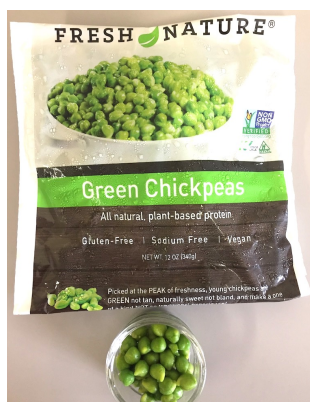
冷凍グリーンひよこ豆

フレッシュ・ネイチャー・フーズ社は、家族経営の食品メーカー。創業以来、技術革新と農産物の持続可能性を追求することを会社のモットーに掲げ、育成、栽培、早生の収穫と生の原料からIQF製品を生産加工することに世界で初めて成功した会社です。当社製品はNON-GMOであるだけでなく、グルテンフリー、アレルギーフリーの植物性たんぱく質をたっぷりと含んだスーパーフードとして、全米の小売・外食業界から大きな注目を浴びています。健康に良い新食材や、植物性プロテイン製品をお求めのお客様、単に新鮮で美味しい食材をお探しの方々にとって、当社のひよこ豆製品は様々なニーズにぴったりの素晴らしい食のソリューションになり得ることでしょう。小売用、業務用、PB開発用の各種ひよこ豆製品をぜひご用命下さい。