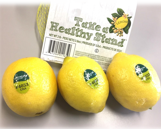
Limoneiraブランド カリフォルニア産クラシックレモン

リモネイラ社 (カリフォルニア州) Limoneira from California