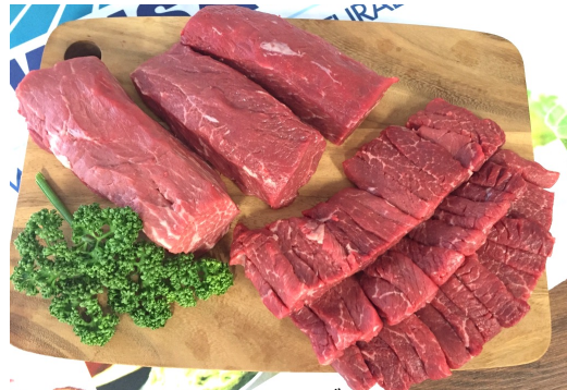
チャックテンダー