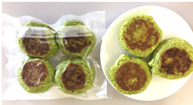
冷凍ひよこ豆ファラフェル (成形・加熱済み)